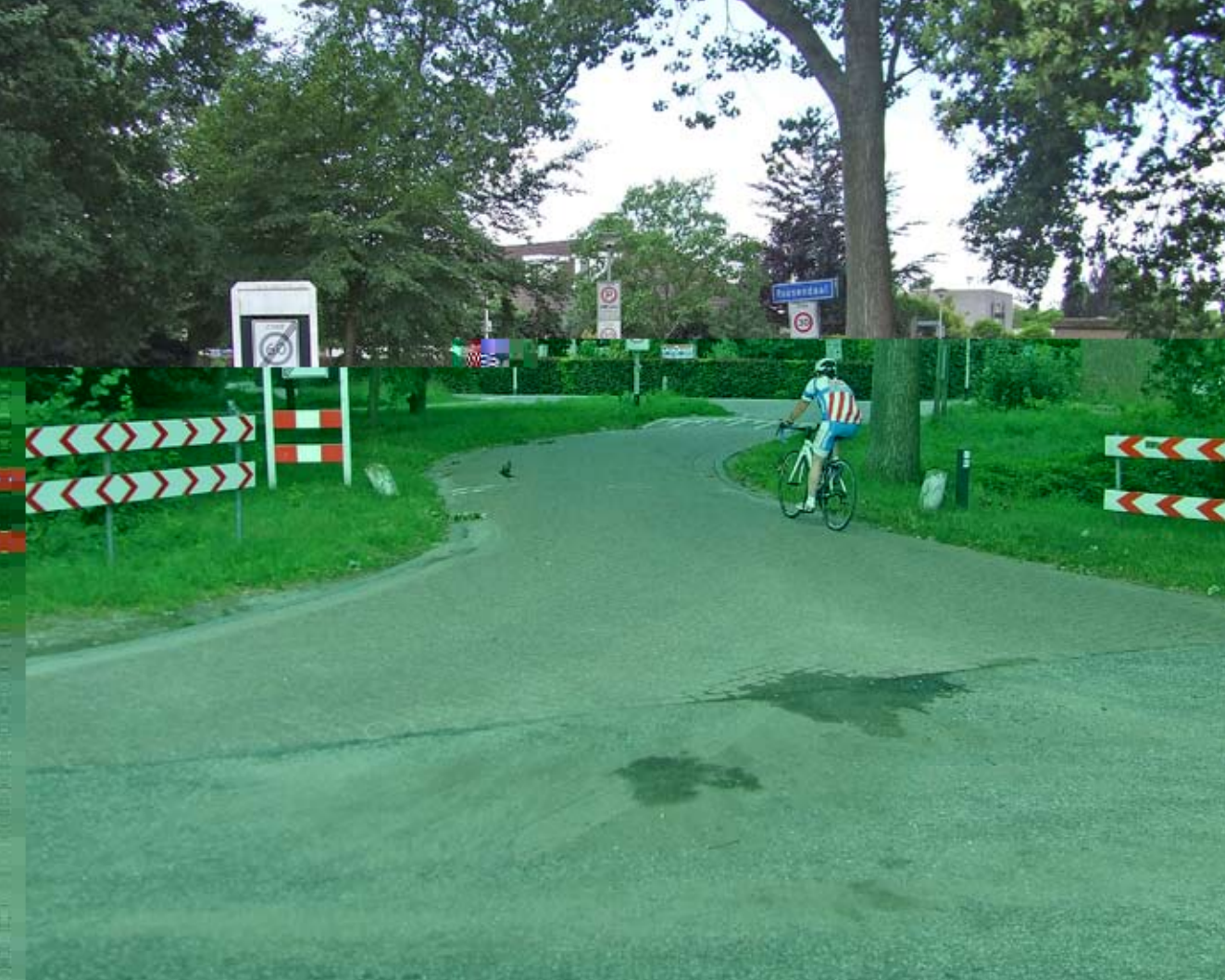
Krampenloop Roosendaal - Langendijkstraat Rucphen